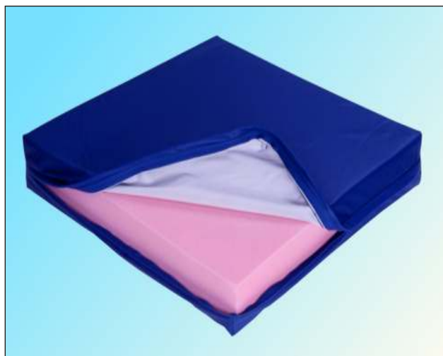
Podložku plně hradí ZP

Rozměry: 42x42x5cm KÓD 13/0039803 42x42x8cm KÓD 13/0011422