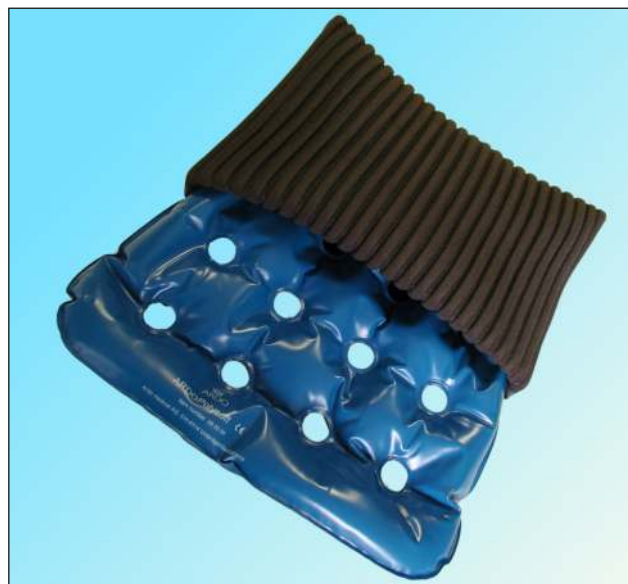
Podložku plně hradí ZP