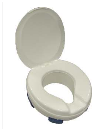
Nástavec CLIPPER III KÓD 12/0011431

Plastový s víkem, výška 10 cm. Uchycení pomocí čtyř zarážek, snadná manipulace. Nosnost: 185 kg Hmotnost: 1,9 kg