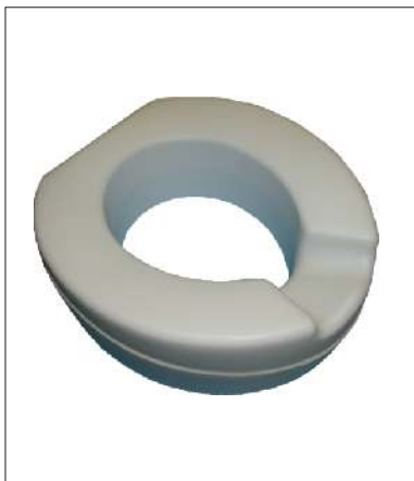
Nástavec CONTACT KÓD 12/0018587

Vyroben ze speciální elastické hmoty, která snižuje riziko tvorby dekubitů. Výška 11 cm. Spodní profil nástavce zabezpečuje pevné uchycení na toaletní mísu. Nosnost: 185 kg Hmotnost: 2 kg