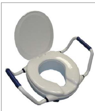
Nástavec CLIPPER V KÓD 12/0011433

Plastový s víkem a madly pro snazší vstávání z toalety, výška 10 cm. Uchycení pomocí 4 zarážek, snadná manipulace. Nosnost: 100 kg Hmotnost: 2,5 kg