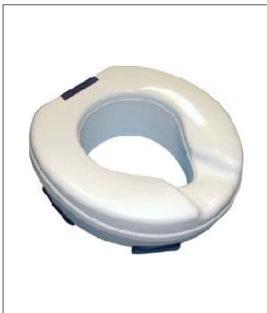
Nástavec CLIPPER II KÓD 12/0011430

Plastový, výška 10 cm. Uchycení pomocí čtyř zarážek, snadná manipulace. Nosnost: 185 kg Hmotnost: 1,5 kg