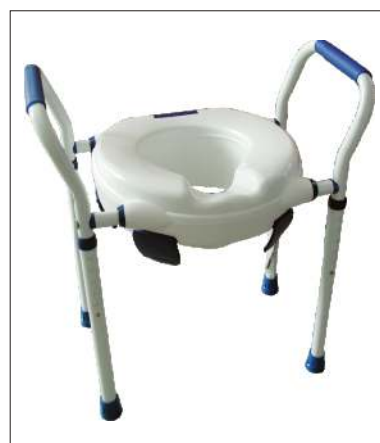
Nástavec CLIPPER VI KÓD 12/0093013

Plastový s madly a podpůrnou konstrukcí pro snazší vstávání z toalety. Výškově nastavitelný, přenosný, snadná manipulace. Nosnost: 150 kg; Hmotnost: 5,2 kg Výška: 52-65 cm