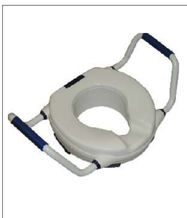
Nástavec CLIPPER IV KÓD 12/0011432

Plastový s madly pro snazší vstávání z toalety, výška 10 cm. Uchycení pomocí čtyř zarážek, snadná manipulace. Nosnost: 100 kg Hmotnost: 2,1 kg